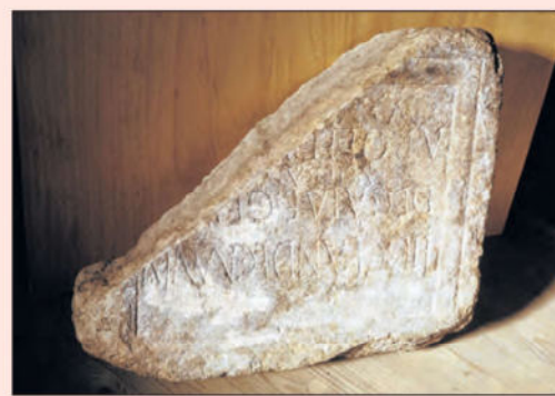
Eine Grabplatte, die eine Fläche von 60x70 cm und eine Dicke von 16 cm hat.