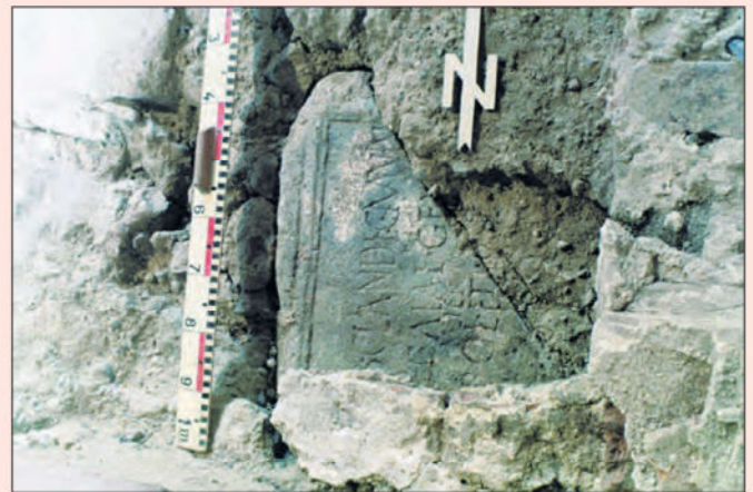
Der vermauerte römische Inschriftenstein wurde im späten Mittelalter für den Bau der Kirche wiederverwendet.