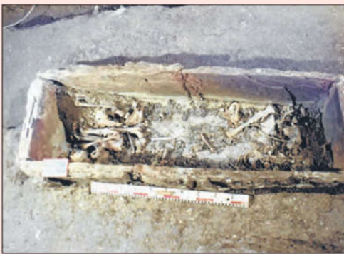
Grab 21: Erwachsenen- grab, Knochen von mindestens zwei Menschen; das Grab war mit einer grossen Steinplatte gedeckt.