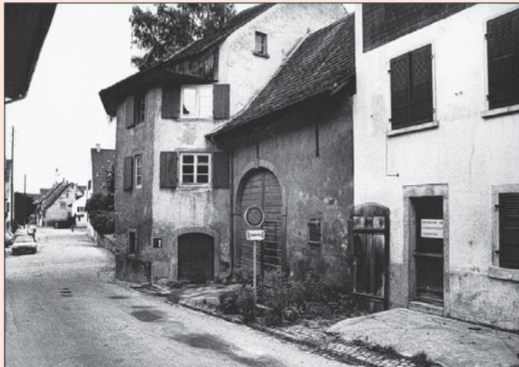
Um 1980. Die Türe im Haus führt zu einem Keller. Rechts anschliessend die Scheune und das geschlossene «Chalet».