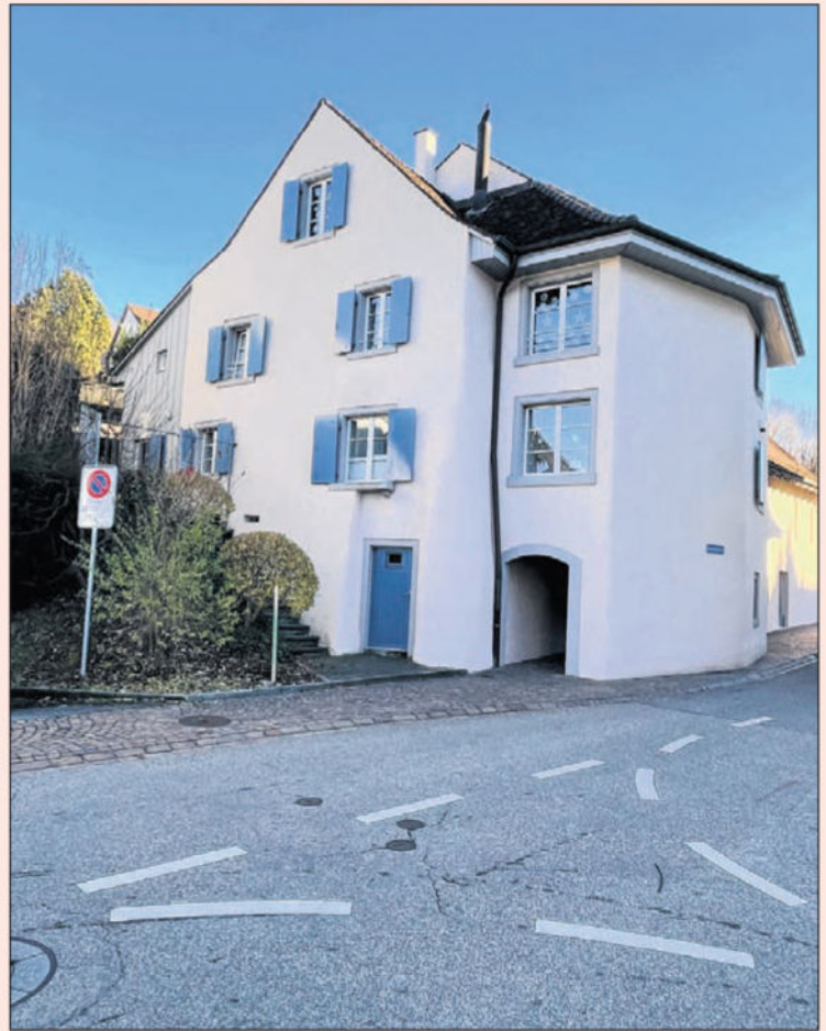
Gleicher Standort 2021.