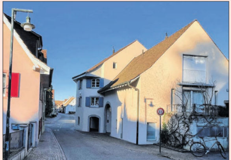
Gleicher Standort 2021.

Das Türmlihus ist dafür bekannt, dass das Trottoir durch das Gebäude geht. Bei der Verbreiterung der Gempengasse verzichtete man auf den Abriss eines Hausteils. Diese Situation ist nicht die einzige in Muttenz. Eine gleiche Situation haben wir beim Haus Hauptstrasse 45/Ecke Hinterzweienstrasse, wo das Trottoir durch die ehemalige Stube läuft.