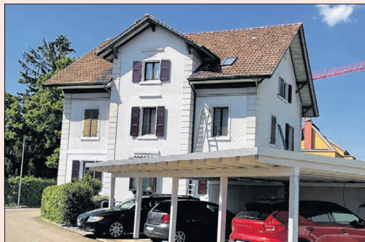
Das Wohnhaus ist als einziges Gebäude stehen geblieben, 2021.

Foto Umfrage über die Landwirtschaftsbetriebe in MuttENZ von 1994, Museen MuttENZ